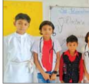
शहर वार्ताहर/ रामटेक