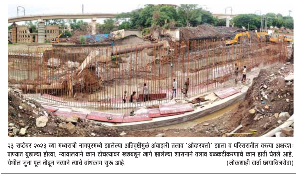
२३ सप्टेंबर २०२३ च्या मध्यरात्री नागपूरमध्ये झालेल्या अतिवृष्टीमुळे अंबाझरी तलाव 'ओवरफ्लो' झाला व परिसरातील वस्त्या अक्षरशः पाण्यात बुडाल्या होत्या. न्यायालयाने कान टोचल्यावर खडबडून जागे झालेल्या शासनाने तलाव बळकटीकरणाने काम हाती घेतले आहे. येथील जुना पूल तोडून नव्याने त्याचे बांधकाम सुरू आहे.